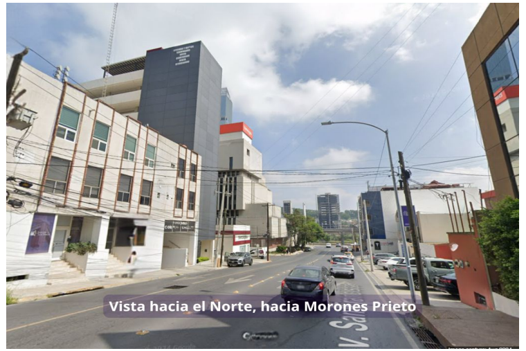
Vista hacia el Norte, hacia Morones Prieto