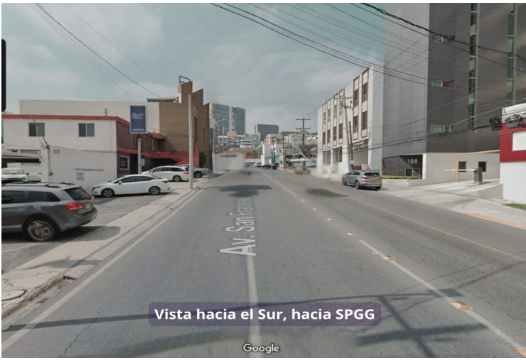
Vista hacia el Sur, hacia SPGG